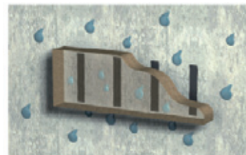
Strangweiser Auftrag (senkrecht):

Bei dieser senkrechten Auftragsweise kann sich keine Feuchtigkeit ansammeln, sie tritt unterhalb des Werkstückes wieder aus (Kondensationsfeuchtigkeit oder direkt einwirkendes Wasser).